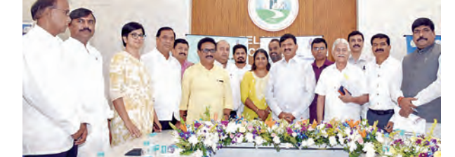
పాత్రికేయ సంఘాల నేతలతో మంత్రి పొంగలేటి శ్రీనివాసరెడ్డి

హైదరాబాద్, ఏప్రిల్ 30, ప్రభాతవార్త ప్రధాన ప్రతినిధి: రాష్ట్రంలో అర్హతైన ప్రతి జర్నలిస్టుకు అక్రిడిటేషన్ మంజూరు చేసేందుకు ప్రభుత్వం కృతనిశ్చయంతో ఉందని రాష్ట్ర సమాచార, రెవెన్యూ, హౌసింగ్ శాఖ మంత్రి పొంగలేటి శ్రీనివాసరెడ్డి స్పష్టం చేశారు. పాత్రికేయులకు ఆరోగ్యతోపాటు మరిన్ని సౌకర్యాలు కల్పించేందుకు ప్రభుత్వం సిద్ధంగా ఉందని అన్నారు. గురువారం నాడు సమాచార శాఖ అధ్యక్షులు జర్నలిస్టులకు కొత్త అక్రిడిటేషన్ కార్డులను మంత్రి అందజేశారు. ఈ సందర్భంగా మంత్రి ముఖ్యమంత్రి గత ప్రభుత్వం ఇచ్చిన అక్రిడిటేషన్ కార్డులను ఇంతవరకు పొడిగించామని, దేశంలో, ఇతర రాష్ట్రాల్లో అమలు చేస్తున్న ఉత్తమ విధానాలను ఇక్కడ అనుసరించాలని ఆలోచన చేసిన మేరకు పరిశీలన సాగించిన అందువల్లే ఈ కార్డుల జారీలో ఆలస్యం చోటుచేసుకుందన్నారు. గత ప్రభుత్వం 32,500 మందికి అక్రిడిటేషన్ ఇచ్చి అవకాశం ఉన్నా 23,352 కే పరిమితం చేసిందన్నారు. తమ ప్రభుత్వం ఇప్పుడు సుమారు 46 వేల మందికి పైగా అక్రిడిటేషన్ ఇచ్చేలా ఇప్పుడు ఇచ్చేందుకు చేసింది తెలిపారు. ఇప్పటికే సుమారు 2,800 వరకు కార్డులను ఆమోదించడం జరిగిందని వివరించారు. జర్నలిస్టుల సూచనల మేరకు జీవోలలో మార్పులు చేర్పులు చేశామని, అర్హతైన జర్నలిస్టులకు కార్డుల మంజూరులో వెనకదగు ప్రస్తావన లేదని అన్నారు. మే 1వ తేదీన అన్ని జిల్లాల్లో అక్రిడిటేషన్ కార్డుల పంపిణీ చేయాలంటూ కలెక్టర్లకు ఆదేశాలు జారీ చేస్తామని మంత్రి పొంగలేటి ప్రకటించారు. ఈ ప్రక్రియలో మే 10 వతేదీన ఒక కలాఫ్ డేట్ గా పెట్టుకోని దరఖాస్తులు చేసుకోవాలని, ఆ తేదీలోగా ఒకటి దరఖాస్తులు ఆమోదించడం జరుగుతుందని మంత్రి తెలిపారు. రాష్ట్రంలో అక్రిడిటేషన్