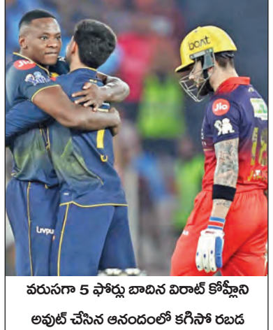
వరుసగా 5 ఫోర్లు బాదిన మిరాట్ కోస్టియూక్ అవుట్ చేసిన అనందంలో కిగిరీ రబబ

మహిళల సింగిల్స్లో మార్గా కోస్టియూక్ జైత్రయాత్ర కొనసాగుస్తూ సెమీఫైనల్ చేరింది. క్వార్టర్ ఫైనల్లో ఆమె 7-6, 6-0తో 13వ సీడ్ లిండా నోస్కోవాకు గెలిచి వరుసగా 10వ విజయాన్ని నమోదు చేసింది. ఈ విజయంతో ఆమె లక్సీ లూజర్ అనస్టాసియా పాటాచోవాతో సెమీ ఫైనల్ పోరుకు అర్హత సాధించింది. 26వ సీడ్ అయిన ఈ ఉక్రెనియన్ క్రీడాకారిణి 23 ట్రైక్ పాయింట్లను సృష్టించింది.